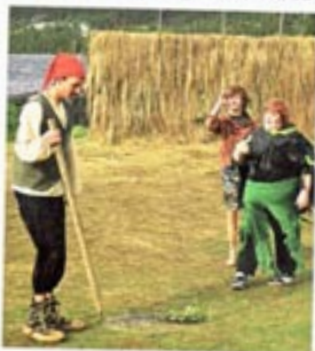
Den grønneklede

De har dog forberedt seg ved at høre om Peer Gynt og hans liv, de har hørt sangene og gjennomgået teksten, så