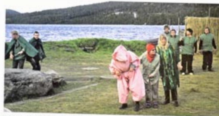
På kjøretøyet skal godfolk kjennes.

de ved, hva det hele handler om. Af aktivitetene har de deltageret i musikk og alle nyder samværet med de nye venner fra hele Norden. Der bliver knyttet kontakter – nogle af dem kan måske vise seg at blive varige.