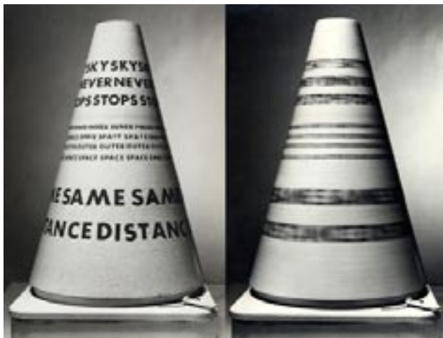
Lilian Lijn, Sky Never Stops, 1965, Collection V&A Museum

I London var der i sommer en udstilling, Poor. Old. Tired. Horse. på ICA. Den handlede om tekstbaserede kunstpraksisser, inspireret ikke mindst af den konkrete poesi, men inddrog også beslægtede strømninger fra 60'erne og 70'erne og omfattede desuden en række yngre kunstnere.